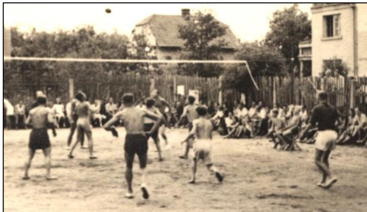
Foto: Z volejbalového turnaje mužů na hřišti SOJ v zahradě u Mašků. Diváků je všude vidět hodně.

uvedené údaje se zakládají na pravdě, a že tedy zde tak skvělá sportovní a společenská atmosféra existovala. A to jak v době předválečné - krizové, tak ještě nějaký čas na začátku II. světové války, která začala násilnou okupací ČSR a následně zasáhla krutě do života lidí celého světa. Ale o tom už je jiná kapitola.