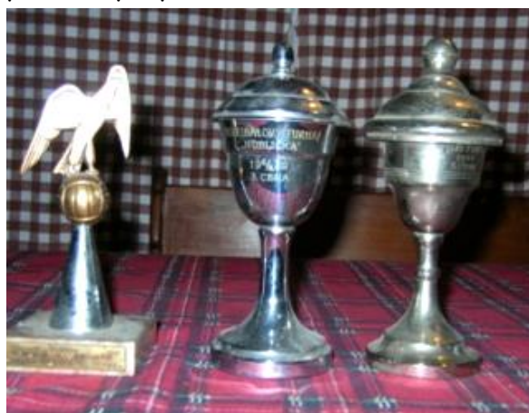
Foto: Mnohé napovídají poháry, tehdy vybojované na turnajích volejbalovým družstvem Sokola Káraný.

Přestože fotky nemohou sloužit k rozpoznání jednotlivců, jejich úkolem je hlavně doložit, že