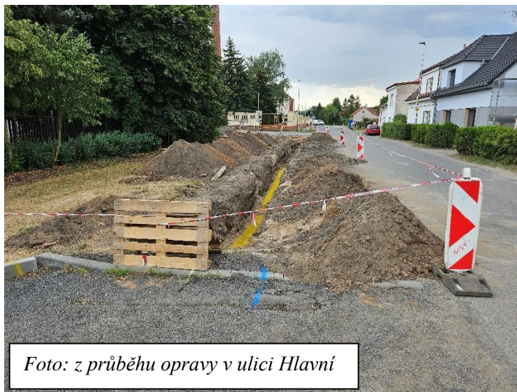
Foto: z průběhu opravy v ulici Hlavní

developery a stavebníky, kteří hodlají v obci realizovat novou výstavbu nebo tu stávající rozšiřovat. Principem je před novou výstavbou uzavřít s obcí plánovací smlouvu nebo smlouvu o spolupráci, kde bude na základě hrubé podlažní plochy definován poplatek obci. Výše příspěvku byla stanovena následovně: