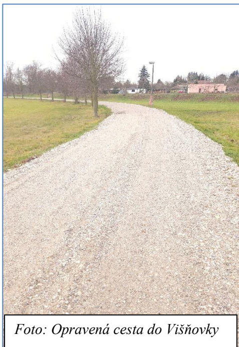
Foto: Opravená cesta do Višňovky

Letošní březen nás potrápil nejednou mrazivou nocí. Ale přesto se mnoho lidí vrhlo na své zahrádky a využilo službu svozu bioodpadu nově již od počátku března každé sudé úterý. V tomto období ale opět platí možnost zbavovat se suchého bioodpadu a větví na místě pro pálení čarodějnic. Samozřejmě to nesmí být starý nábytek a stavební dřevo. Pokud budete chtít dorazit autem s vozíkem kontaktujte pana místostarostu na telefonním čísle 777837231. Bude vám otevřena závora z ulice B. Němcové, jako již několikátý rok. Velkokapacitní kontejnery v místě křižovatky ulic Hlavní, Jizerská a Okružní budou i letos vyváženy dle potřeby.