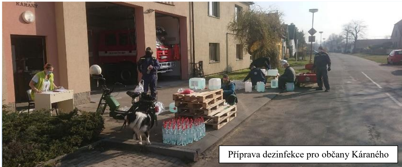
Příprava dezinfekce pro občany Káraného