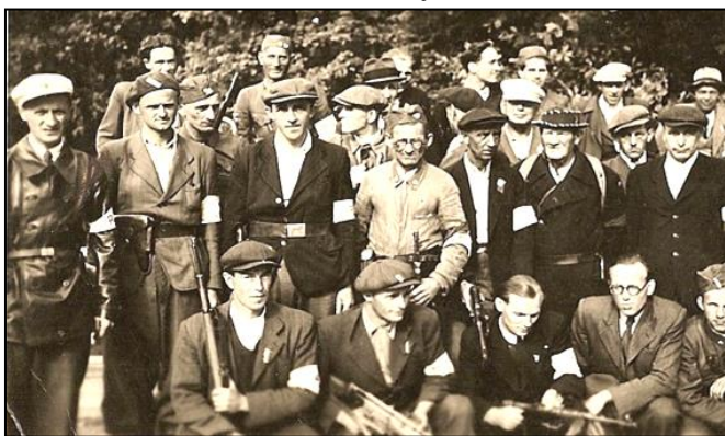
Foto z květnové revoluce a konce války: Skupina zdejších revolucionářů na jizerském mostě.

Skutečnost uvedená v poslední větě předchozího odstavce usnadnila zdejším revolucionářům obsadit vodárnu krátce po vyhlášení tzv. pražského (ale prakticky celonárodního) povstání. To znamenalo nejen eliminaci německého vlivu na zdejší území, ale i získání zbraní, které se pak velice hodily v následujících událostech, kdy přes zdejší lesy, řeky a mosty, se přesouvaly ozbrojené elitní německé jednotky z Milovic, aby potlačily pražské povstání, a zničily Prahu. Ten zmíněný pohyb německých vojsk vyvolal celou řadu přestřelek na zdejší území, zejména pak u sv. Václava, u železničního mostu a nejvíce u mostu přes Jizeru. Posloupnost událostí se zde odvíjela od první schůze revolučního národního výboru, připravovaného ještě před koncem války, protože se zde za vedení pana Františka Faltyse, (5. května 1945 v 8,30 hod), než v Praze vypuklo protiněmecké povstání.