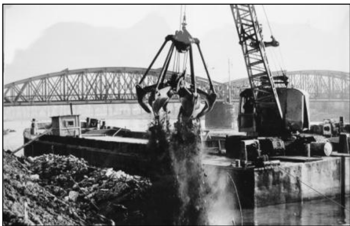
jeřábový bagr zasypá vározdvoující se Labe pod železničním mostem. Díky tomu byl postupně umrtven průtok pravým - pro koupání a rekreaci nevýznamnějším ramenem řeky, s největšími plážemi.

Hlavní část regulace zdejšího úseku Labe (= prokopání ostrova) byla provedena z velké části ručně cca v letech 1934 - 1952. V tomto úseku (Čelákovice-Káraný) protнула někdejší, přibližně 2,5 kilometru dlouhý labský ostrov, jak naznačuje čerchovaná čára v mapce z roku 1936 (viz Zpravodaj č. 285 ).