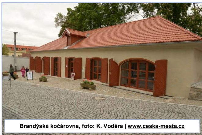
Brandýská kočárovna

MAS Střední Polabí uspěla s žádostí o pronájem prostor v nově zrekonstruovaném objektu brandýské kočárovny. Ve dvou místnostech postupně vznikne Regionální centrum MAS Střední Polabí.