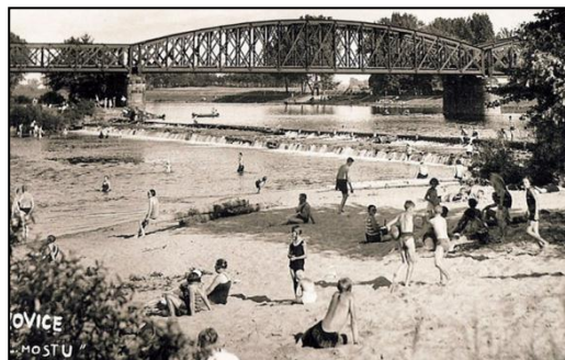
Skvělá pohlednice z čelákovického atelieru Filípek - dokládá, že díky regulaci zanikla i tato skvělá scenérie u mostu s někdejší koupalištěm.

Negativní dopady regulace se týkají hlavně definitivního zániku polabských lužních (zátopových) lesů a likvidace zdejších nádherných říčních koupališť s rozlehlými plážemi. Pozoruhodné je, že zatímco jedni představitelé Čelákovic, koncem 19. století vznášeli úpěnlivé žádosti o regulaci, tak jejich následníci ve 30. letech obrátili argumentaci o 100% a prosili o zachování Labe v původním stavu. Jednoduše proto, že koupaliště, objevená ve 20. letech 20. století přinesla městu velice slušné zisky.