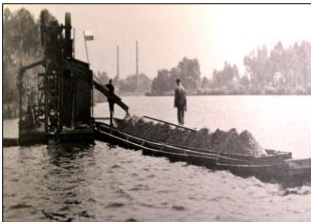
Foto bagr těžící na Labi u Toušeně písek