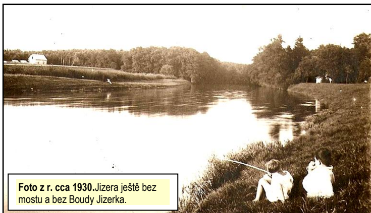
Foto z r. cca 1930. Jizera ještě bez mostu a bez Boudy Jizerka.

Elegance, lehkost a skvělé posazení do krajiny z něj vytvořily jeden ze symbolů pěkné krajiny kolem Káraného i Nového Vestce. Kromě toho se stal i významným krokem k rozvoji Káraného.